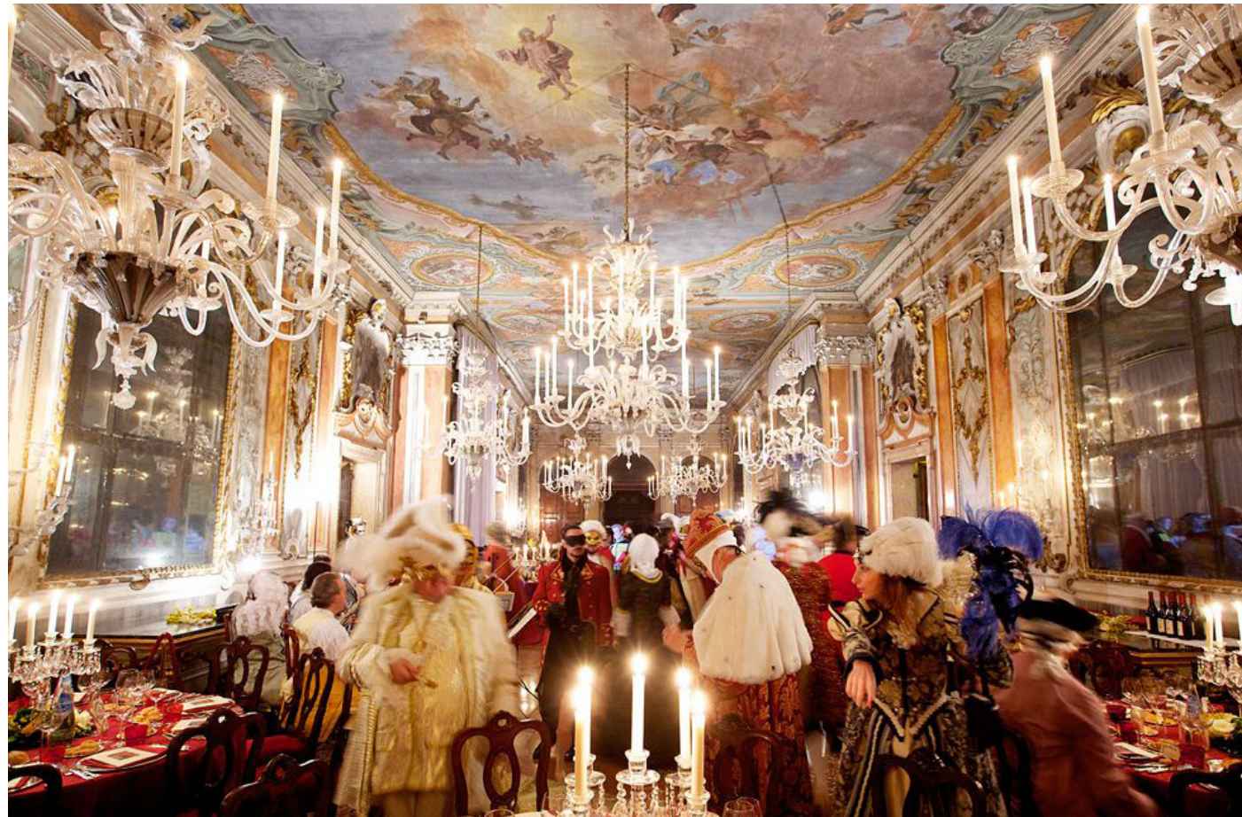
Uma tarde de dança